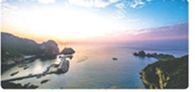
천연기념물 제170호 홍도

흑산도 주변의 크고 작은 섬들을 조망할 수 있어 더욱 아름다운 상라봉 굽이길