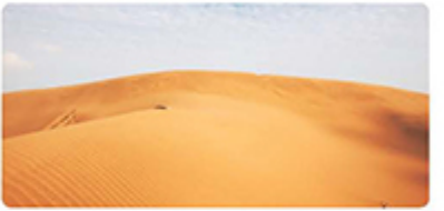
도초 우이도 풍성사구