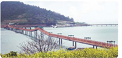
안좌도 소망의 다리

분재와 미술, 자연이 함께하는 문화공간으로 신안을 대표하는 명소가 인기 높음