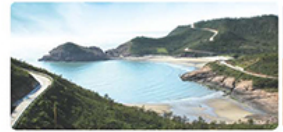
비금 하누님 해변