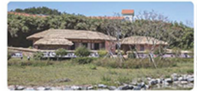
김대중 전 대통령 생가