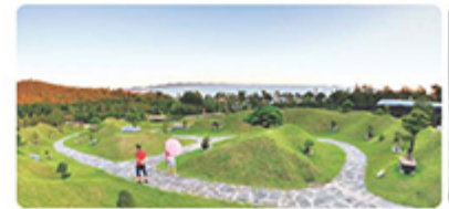
압해도 송공산 분재공원

분재와 미술, 자연이 함께하는 문화공간으로 신안을 대표하는 명소가 인기 높음