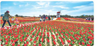
튤립축제(매년 4월 중)

갯벌 위로 놓인 목교에서 쟁쟁어, 게 등 다양한 수생생물을 관찰할 수 있음